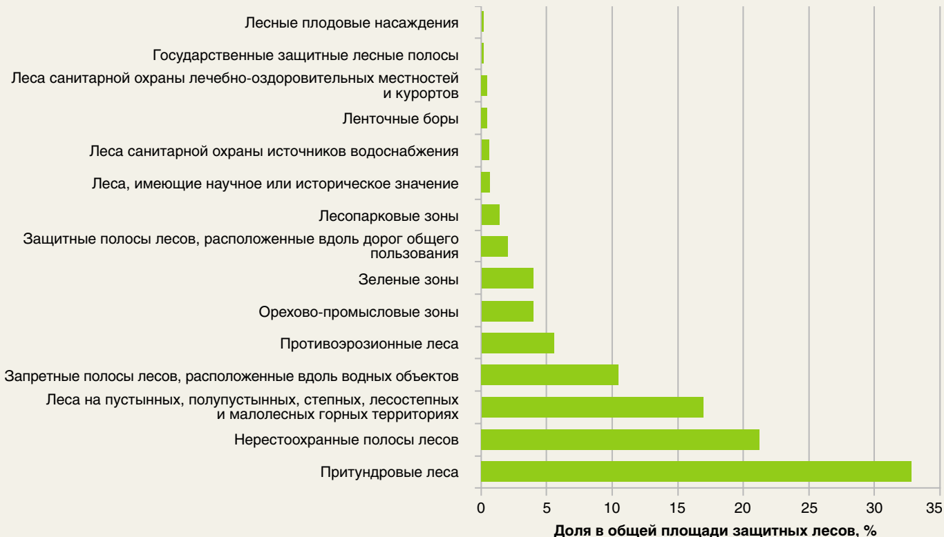
Рис. 3. Относительная площадь различных категорий защитных лесов в Российской Федерации (по данным государственного лесного реестра, 2014 год)

На момент принятия нового Лесного кодекса площадь полос лесов, защищающих нерестилища ценных промысловых рыб, составляла 56 205 тыс. га. К 2014 году эта площадь достигла 56 803 тыс. га [1] (20,4 % площади всех защитных лесов или 4,9 % площади всего лесного фонда), т. е. площадь нерестоохранных полос лесов довольно стабильна, несмотря на значительные изменения площади земель лесного фонда за этот период (рис. 2 и 3).