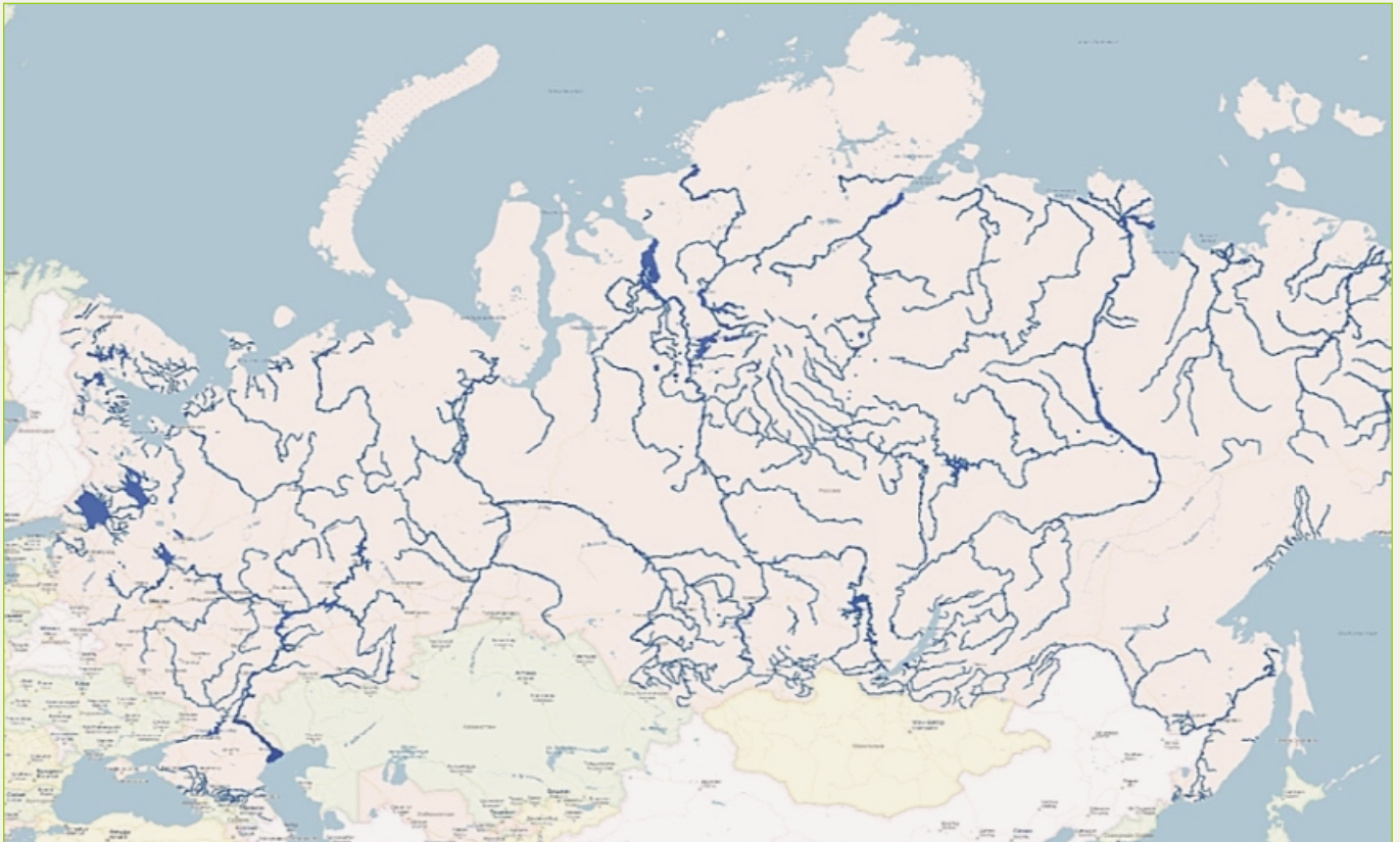
Рис. 1. Водоёмы и выделенные вокруг них запретные полосы лесов для бывшей территории РСФСР в соответствии с постановлениями об утверждении перечня рек, их притоков и других водоёмов, являющихся местами нереста ценных промысловых рыб 4

150–200 коров), а также золотая медаль. Однако с 1917 года, после Октябрьской революции, вновь началась беспорядочная рубка лесов [3].