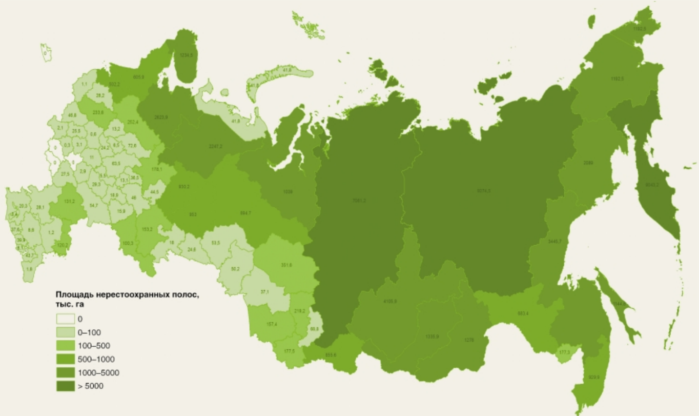
Рис. 4. Площади нерестоохраненных полос лесов в различных административных субъектах Российской Федерации

Нерестоохраненные полосы лесов в силу достаточно серьезных ограничений на рубки леса во многих случаях сейчас представляют собой малонарушенные леса, никогда не подвергавшиеся значимым антропогенным воздействиям (рис. 4). В большинстве административных субъектов Российской Федерации это практически единственные подобные лесные участки (помимо особо охраняемых природных территорий), которые представляют собой важнейший элемент экологического каркаса среди нарушенных территорий, поддерживающий устойчивость лесных экосистем и их биоразнообразие, а также непосредственно выполняют рыбохозяйственные нерестоохраненные функции.